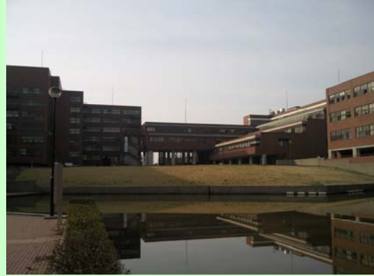
Universidad de Tsukuba

Tuve el placer de trabajar para la Agencia de Cooperación Internacional del Japón, JICA, en su oficina en Chile, entre los años 2006 y 2009. Son años que recuerdo con mucho cariño, no solo por el gran ambiente laboral que mis compañeros creaban, sino también por la gran labor que desarrolla JICA en Chile, a través de sus distintas modalidades de trabajo, entre las que se encuentran los Proyectos de Cooperación, Becas, Programa de Voluntarios, entre otros, construyendo así un hermoso puente de trabajo y esfuerzo entre Japón y Chile