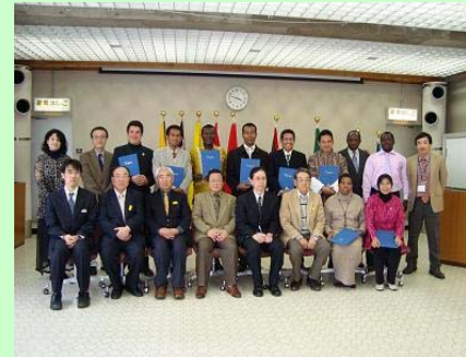
Participantes del Curso PLSD

A través del curso impartido, el profesor Ohama, con su forma impecable de entregar conocimientos y la pasión por el tema, logró hacernos comprender los distintos pasos y lo que cada uno de ellos implica a través de esta metodología, donde la participación no es como tradicionalmente la comprendemos, es decir como el derecho a opinar, a votar, etc, sino que implica un profundo proceso de autoconocimiento, de desarrollo y de aprovechamiento y construcción de capacidades por las distintas comunidades donde se ha aplicado PLSD.