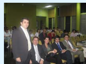
Misión de Evaluación Final

Los principales resultados fueron una mejora en la atención de usuarios a través de un equipo multidisciplinario de profesionales, una mayor calidad de las ayudas técnicas, una mayor coordinación de los usuarios con el sistema educativo pertinente, y con ello, una mejor calidad de vida de los pacientes con discapacidad en Costa Rica.