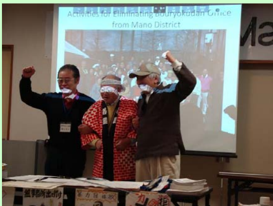
Conociendo la cultura japonesa