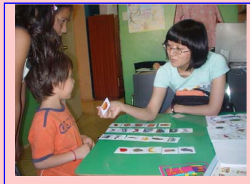
Rehabilitación del Lenguaje con técnicas de Tarjetas

Este punto está ligado directamente a la dificultad en la pronunciación. La mayoría de los sonidos en el idioma japonés son el conjunto de consonante + vocal (por ejemplo, la pronunciación de “ta” es el conjunto de la consonante “t” y la vocal “a”)